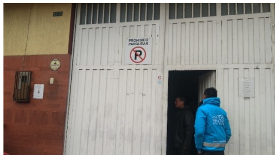
Imagen1. Fachada de establecimiento

La visita realizada el 24 de julio de 2018 al establecimiento Alimentos Spress no pudo ser atendida